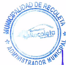
V° B° DIRECTOR JURÍDICO